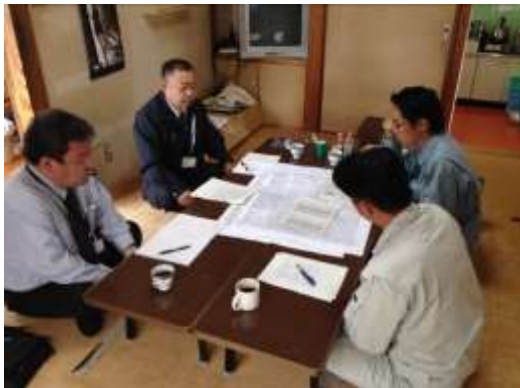
森林経営計画打合せ（策定推進方針等）

今後も、今年度の経営計画の策定目標達成に向けて、随時三者で打合せを行いながら、計画策定を進めていきたいと考えています。