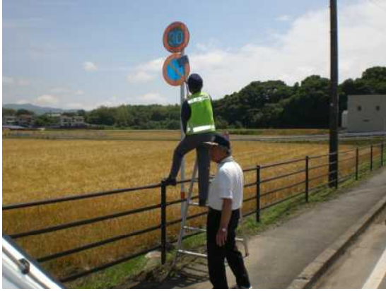
交通標識の整備・清掃