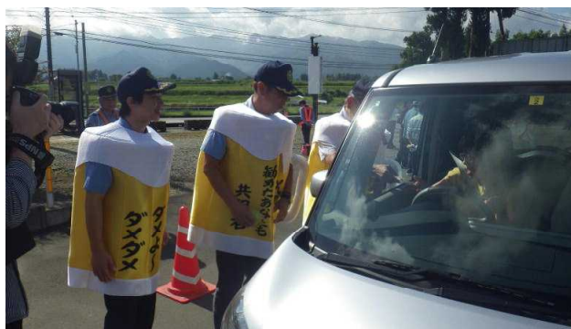
手作りの着ぐるみを着用しての 飲酒運転根絶キャンペーン