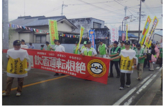
交通安全パレード