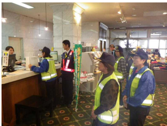
ゴルフ場や飲食店を訪問しての 飲酒運転根絶の広報活動