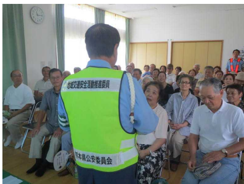
交通安全教育活動